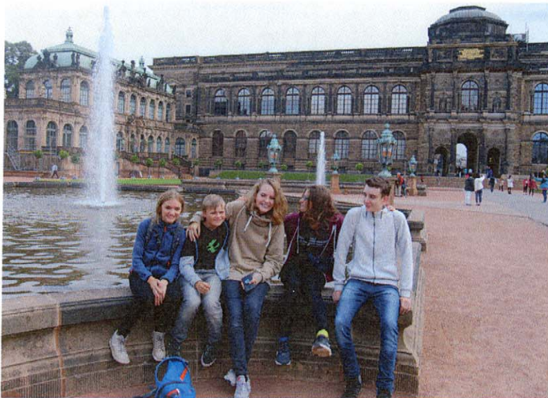
Die aktuellen Hauptkonfirmanden vor der Kulisse des Zwingers in Dresden.