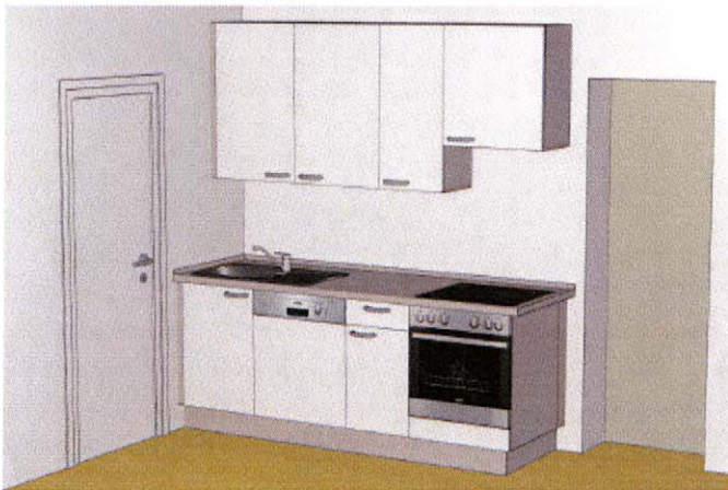
Entwurf der neuen Küche in Lüdershagen. (Bild: G. Ahrens)

In der Gemeinde Lüdershagen gab es den Wunsch nach einem Raum, in dem man gemütlich sitzen, etwas kochen und erzählen kann: die Lösung wurde in einem Durchbruch gefunden, der den ehemaligen Christenlehrerraum mit der Küche verbindet: So wird demnächst eine kleine aber feine Wohnküche entstehen.