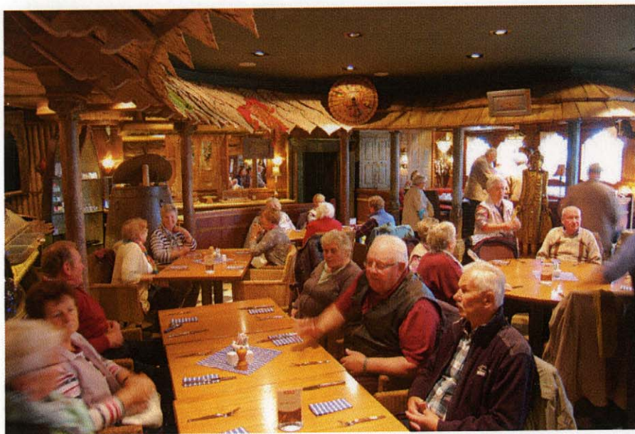
Fröhliche Stimmung beim Mittagessen in der „Nautilus“ auf Rügen