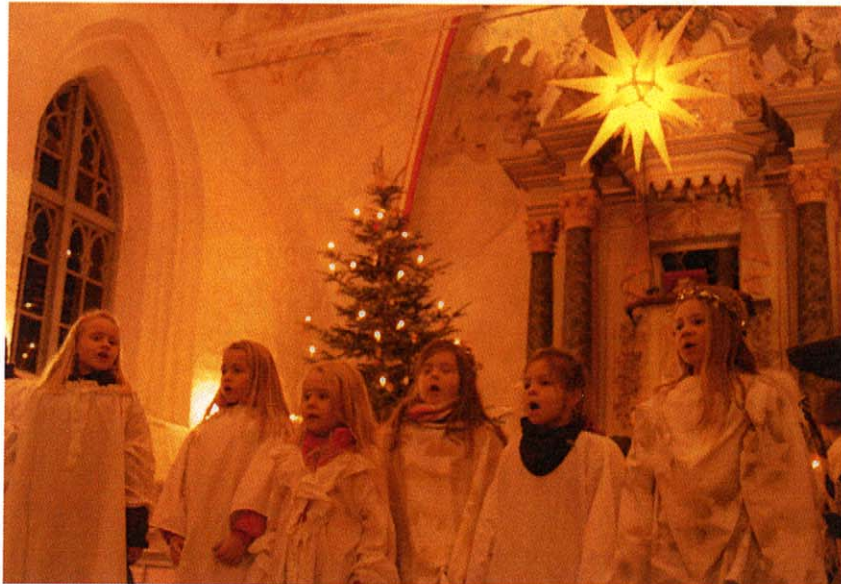
Der liebe Engelchor in Ahrenshagen